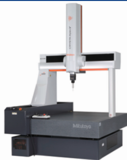
三次元測定機 ミットヨ CRYSTA-Apex