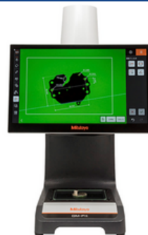
自動画像測定機 ミットヨ QM-Fit