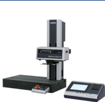
粗さ測定機 東京精密 TOUCH 550