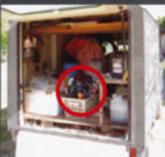
車中保管イメージ